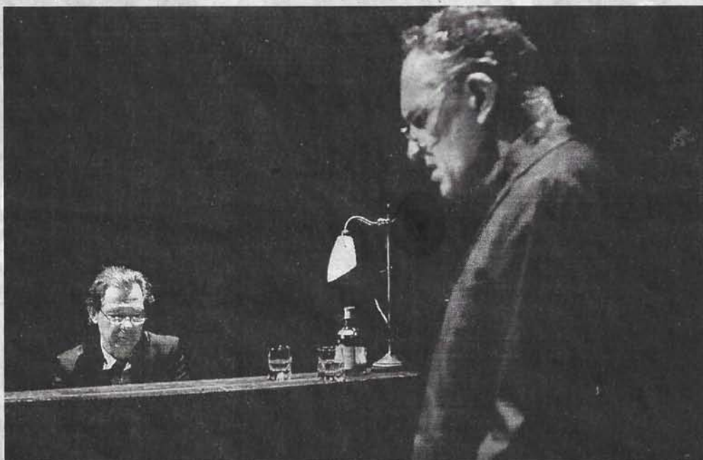
« Novecento pianiste ».

« On me mettrait la tête en bas que rien ne sortirait de mes poches, même ma trompette, je l'ai vendue, j'ai tout vendu, quoi, mais cette histoire-là... non, cette histoire-là je ne l'ai pas perdue, elle est toujours là, limpide et inexplicable, comme seule la musique pouvait l'être quand elle était jouée, au beau milieu de l'Océan, par le piano magique de Danny Boodmann T.D Novecento. Né lors d'une traversée, Novecento n'a jamais mis les pieds à terre. Il passe sa vie sur l'Atlantique les mains posées sur un piano, à composer une musique étrange et magnifique, qui